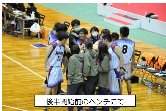
後半開始前のベンチにて